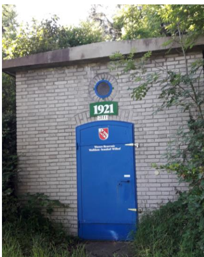
Altes Reservoir Forenholz aus dem Jahr 1921